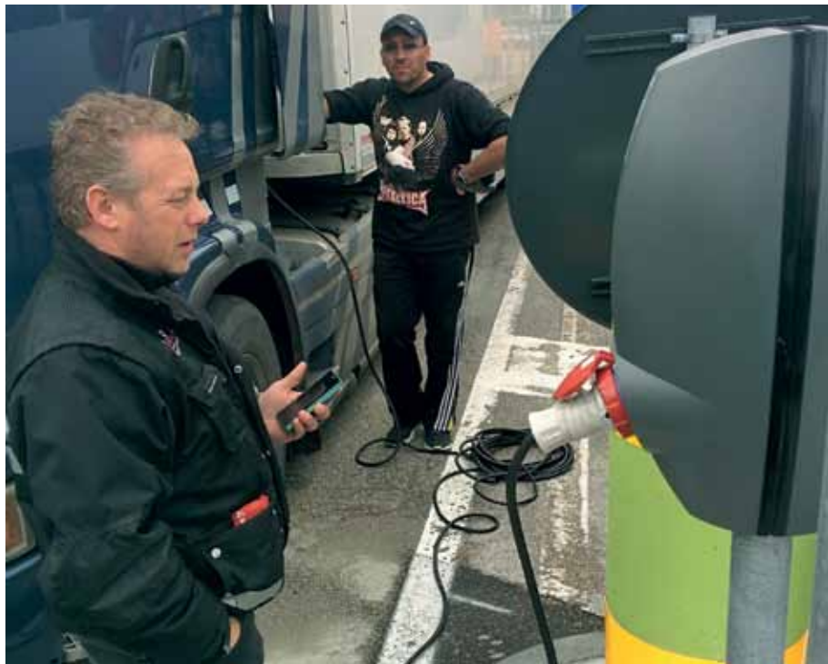
Stromladestellen entlasten Lkw-FahrerInnen und Umwelt

Strombetriebene Lkw-Kühlaggregate sind eine Win-win-Situation für ArbeitnehmerInnen, Unternehmen und Umwelt.