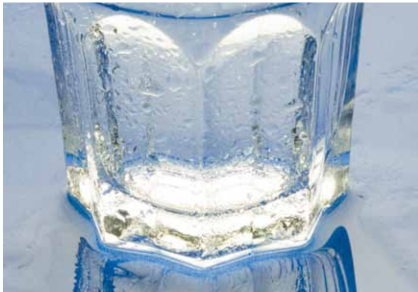
Kein ungetrübter Genuss ohne Nitratreduktion

diese Möglichkeit kaum wahrgenommen wird. So wird für das Marchfeld eine Verschlechterung des Grundwassers sowie ein signifikant anhaltender Trend bei der Nitratbelastung festgestellt – ein Umstand, der zumindest seit 20 Jahren bekannt war. Der Rechnungshof kritisiert, dass weder auf Bundesebene noch auf Ebene des Landes Niederösterreich das rechtliche Instrumentarium ausgeschöpft wurde, um restriktivere Maßnahmen bei der landwirtschaftlichen Nutzung und damit eine deutliche Reduzierung des Neueintrags von Nitrat vorzusehen. Für die zum Teil im öffentlichen Eigentum befindlichen Trinkwasserversorger entstand infolge der hohen Nitratbelastung des Grundwassers durch