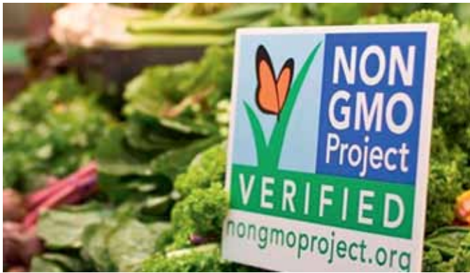
Mehr GVO-freie Lebensmittel auch in den USA

warten sich keine Unterschiede bei den Produkten und der grenzüberschreitende Handel könnte damit erleichtert werden. Mit der Unterzeichnung der „Vienna Declaration“ wird der „GMO-free Danube Standard“ von den beteiligten Organisationen als gemeinsamer anerkannt. SI