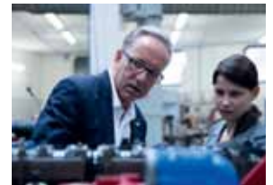
Rudi Kaske AK Präsident

„Österreich braucht einen Big Deal für Arbeit. Ich erwarte mir ... vom Finanzminister klare Zusagen, dass das AMS-Budget für 2016 bis 2019 aufgestockt wird. Es geht darum, unsere Spitzenposition bei der Bekämpfung von Arbeitslosigkeit in Europa zu halten.“