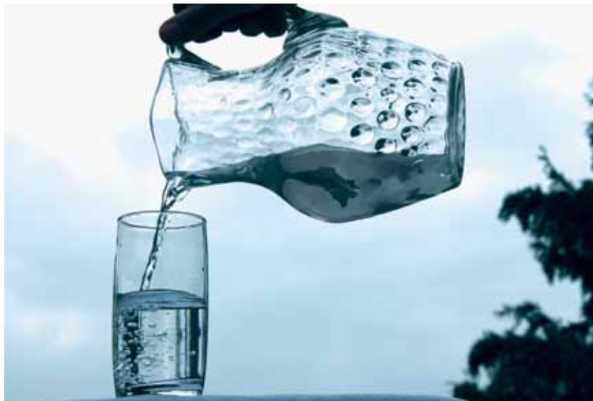
Sauberes Trinkwasser - in Österreich selbstverständlich

Die restlichen 8,4 Prozent der österreichischen Haushalte beziehen Trinkwasser über Hausbrunnen oder private Quelfassungen und unterliegen einer Selbstverantwortung bezüglich der Qualität des Wassers und des Zustandes der Anlage. Damit kommen sie nicht in den Genuss einer regelmäßigen Trinkwasseranalyse und sind manchmal unwissentlich auf Wasser ohne Trinkwasserqualität angewiesen. Dennoch ist der Hausbrunnen bzw. das daraus bezogene „Gratiswasser“ vielen Besitzern sehr wichtig, da sie bei einem Anschluss an ein öffentliches Versorgungsnetz nur die sich daraus ergebenden Kosten und die regelmäßig anfallenden Gebühren sehen. Natürlich hat auch die Errichtung des Hausbrunnens einmal Kosten verursacht und auch die notwendige Wartung von Brunnen und Wasserpumpe ist