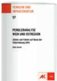
Odilo Seiser: Pendleranalyse Wien und Ostregion. Zahlen und Fakten auf Basis der Vollerhebung 2014, Verkehr und Infrastruktur 57, AK Wien 2016

D ie Daten zeigen, dass Wien ein wichtiger Arbeitsmarkt für die BewohnerInnen der Bundesländer ist. Fast 183.000 ArbeitnehmerInnen pendeln nach Wien, hauptsächlich aus Niederösterreich mit fast 149.000 und aus dem Burgenland mit über 18.000 ArbeitnehmerInnen, die in Wien ihrem Beruf nachgehen.