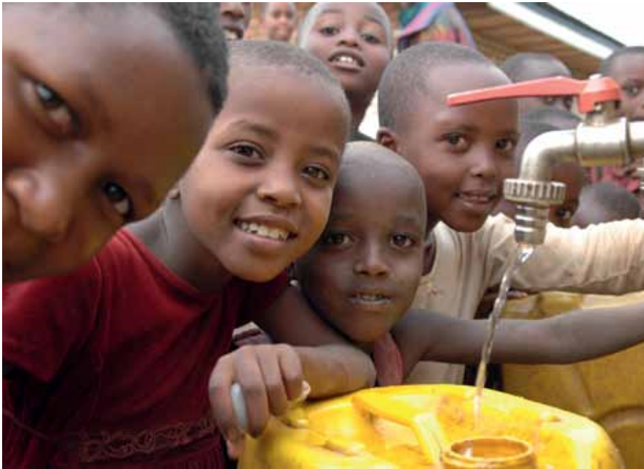
Nutzungskonflikte gefährden den Zugang zu sauberem Wasser