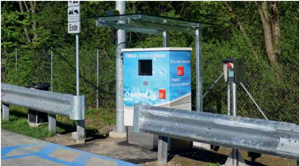
Stromtankstellen für Kühl-Lkw als Pilotprojekt