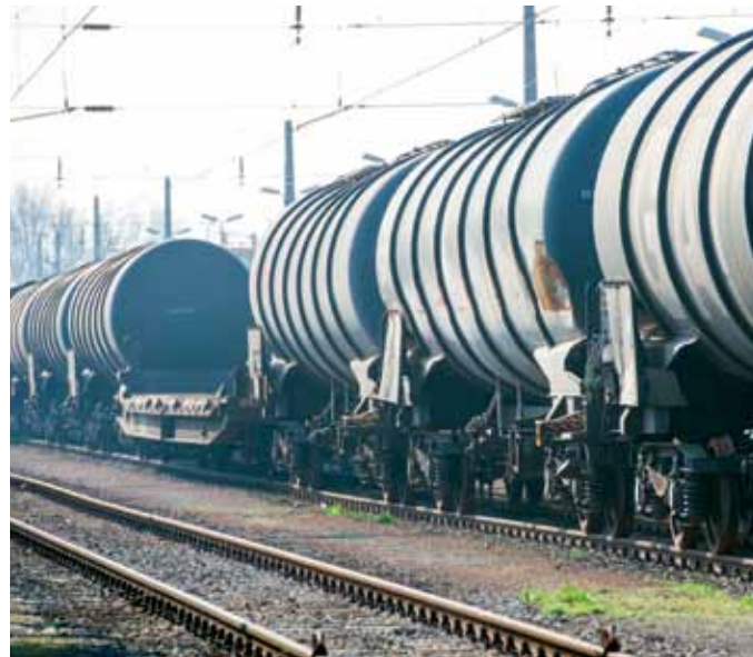
Lärmschutz kommt nur langsam in Fahrt

von Nitrat aus Trinkwasser ist sehr kostspielig; sie wird vor allem durch Haushalte und Behörden finanziert. SI