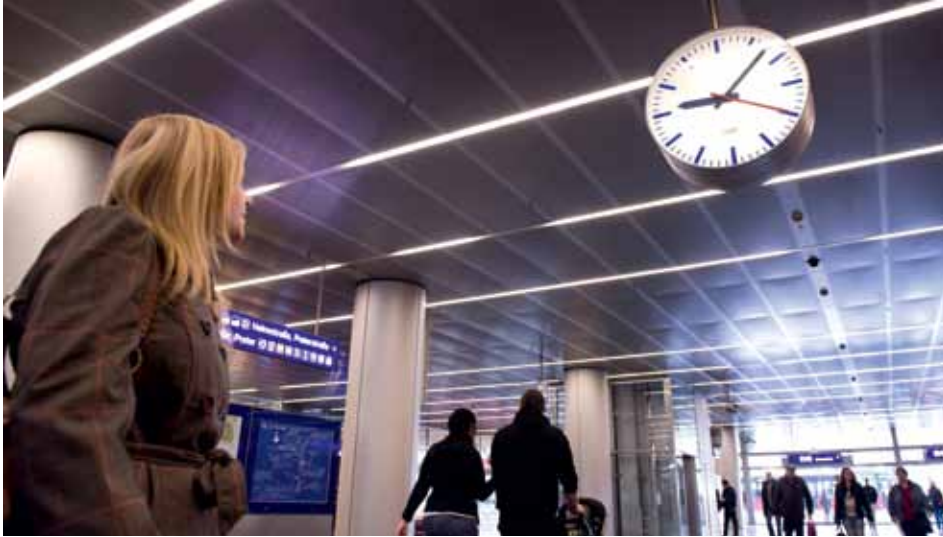
Rasche und sichere Arbeitswege im ÖV sind für die Beschäftigten wichtig