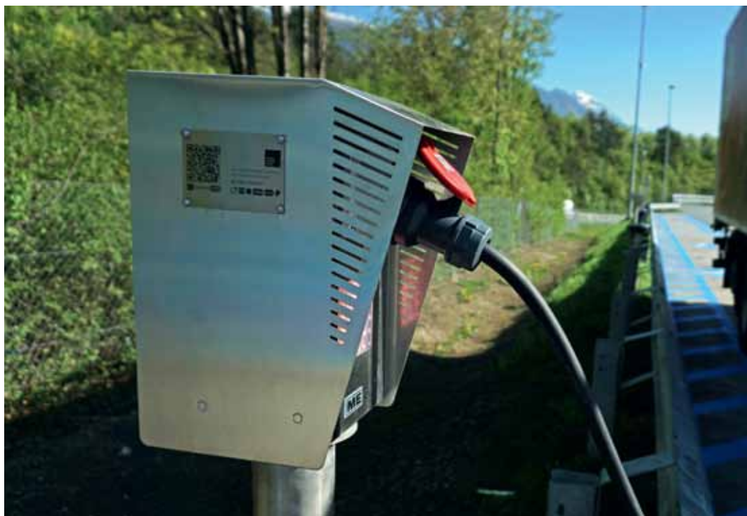
Auch verborgenes Potenzial der Elektromobilität bringt Nutzen

Noch gänzlich unerforscht dagegen sind die Auswirkungen bei Standzeiten in Häfen und großen Warenumschlagszentren, die gerade im urbanen