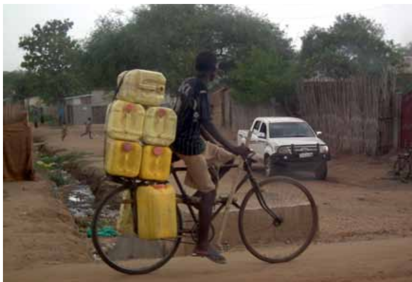
Es ist noch ein weiter Weg zur sicheren Wasserversorgung für alle

Der Ausbau des Zugangs zu sauberem Trinkwasser fand seit dem Jahr 2000 auch Eingang in die globale Entwicklungsagenda. Sowohl die UN-Mil-