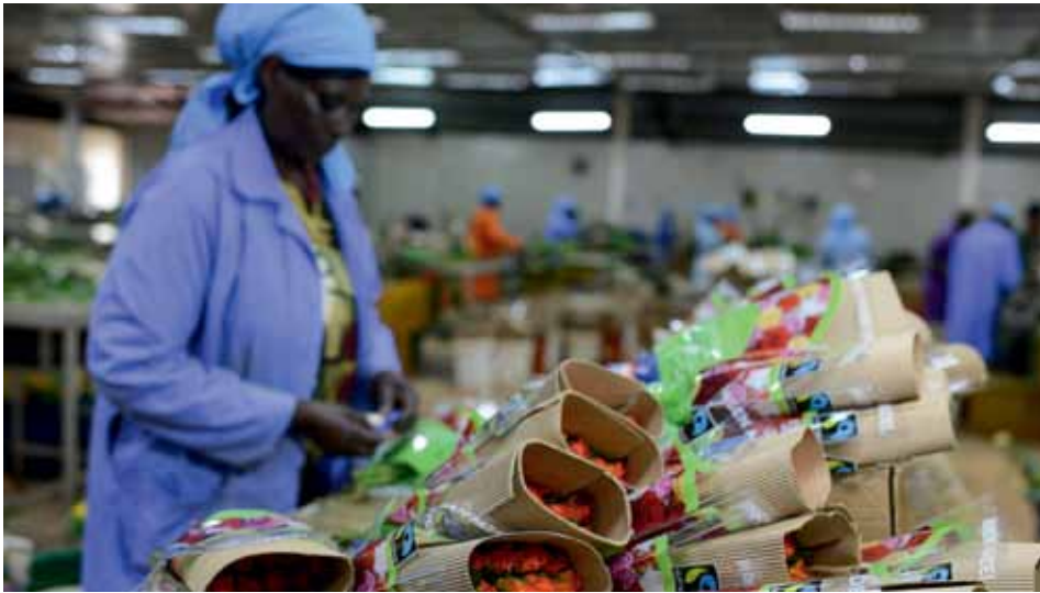
Rosenerzeugung unter fairen Arbeits- und Umweltbedingungen